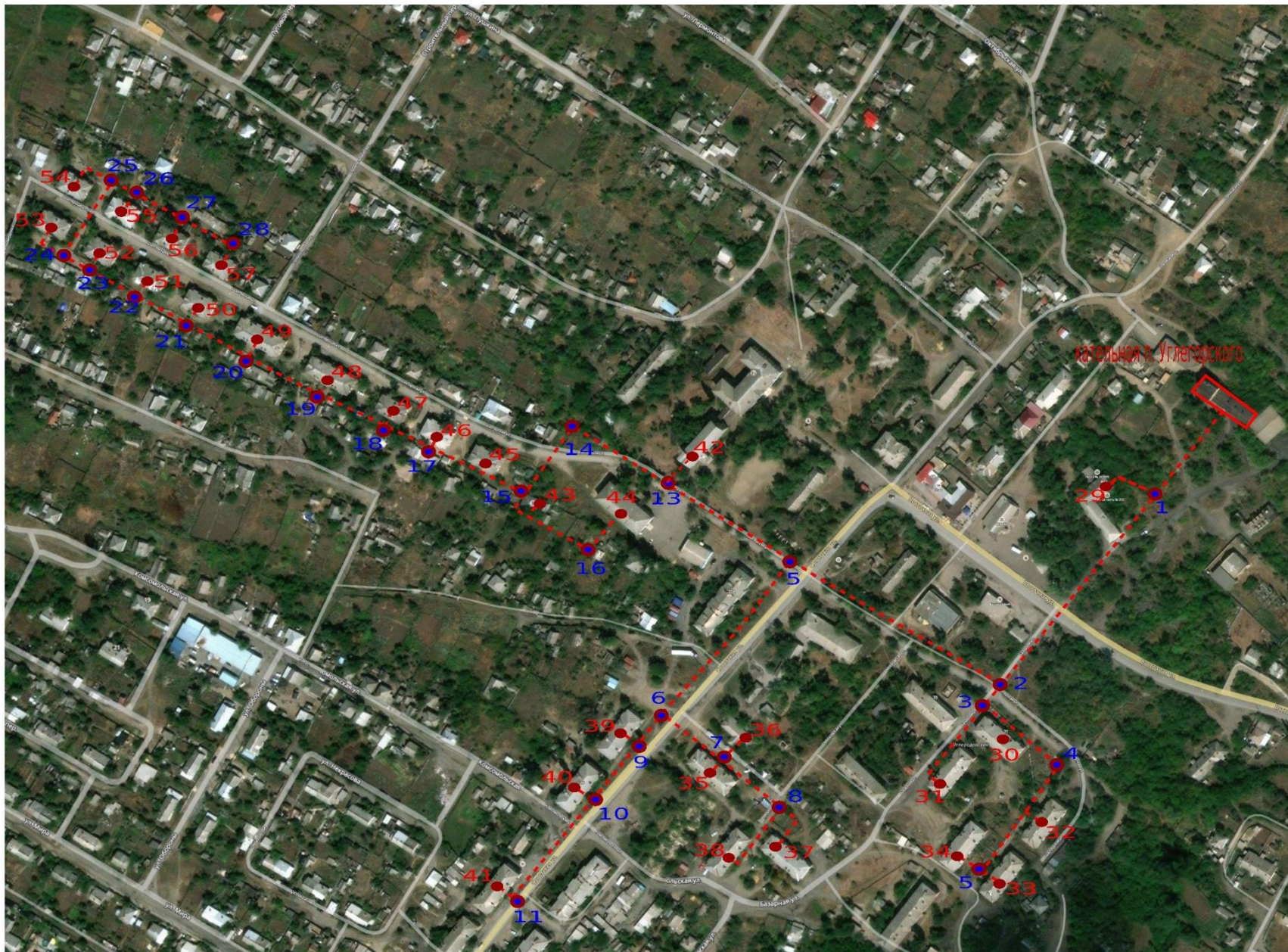
Рис. 1 – Схема тепловых сетей от котельной по адресу: п. Углеродовский ул. Восточная,84г